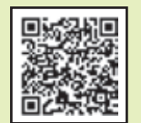
サンスポアナウンス・ドットコム

※悪天候などによる大会当日の開催に関するお知らせはサンスポアナウンス・ドットコムでご案内します。