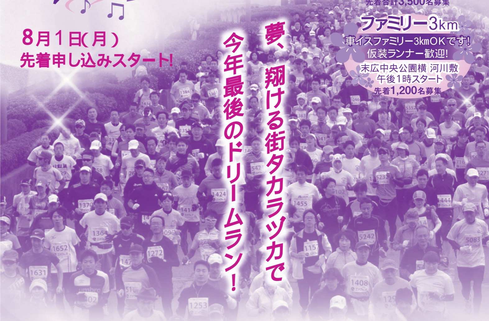
(写真は昨年の大会より)