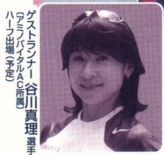
ゲストランナー 谷川真理選手 (ハーフ出場予定)